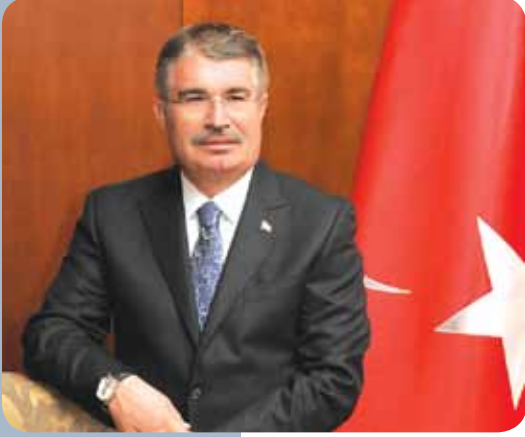
İdris Naim ŞAHİN / İçişleri Bakanı

Türkiye, coğrafi ve jeopolitik konumu itibariyle bölgenin en stratejik noktalarından birisinde; sistemli yapısal değişikliklerin cereyan ettiği ve tarihsel birikim ve potansiyelinin gereği olarak uluslararası ölçekte vazgeçilmez bir aktör olma misyonunu her geçen gün güçlendirmektedir. Buna paralel olarak İçişleri Bakanlığı da uluslararası temaslarda aktif rol alarak, bu tarihsel gelişim ve değişime katkı çabası içerisinde.